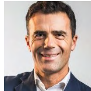
Secrétaire général Sandro GOZI