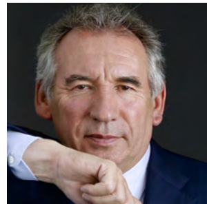
Président François BAYROU

Nous faisons partie du groupe Renew Europe au Parlement européen.