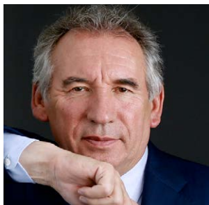
Président François Bayrou

Le Parti Démocrate européen, fondé en 2004 par François Bayrou et Francesco Rutelli, est un parti politique centriste européen qui rassemble des partis politiques et des députés européens qui veulent une Union plus proche de ses citoyens. Le Parti Démocrate européen, mouvement politique transnational, entend œuvrer à bâtir une démocratie européenne qui s'ancre dans les valeurs partagées de paix, de liberté, de solidarité et d'éducation, tout en ambitionnant d'affirmer fièrement sa culture dans le monde futur.