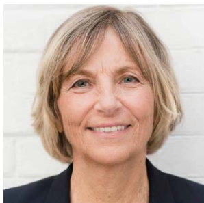
Secrétaire générale Marielle de Sarnez