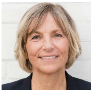
Secrétaire générale Marielle de Sarnez