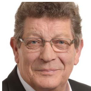
Délégué général Gérard Deprez