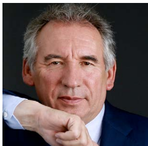
Président François Bayrou

Le Parti Démocrate européen, fondé en 2004 par François Bayrou et Francesco Rutelli, est un parti politique centriste européen qui rassemble des partis politiques et des députés européens qui veulent une Union plus proche de ses citoyens. Le Parti Démocrate européen, mouvement politique transnational, entend œuvrer à bâtir une démocratie européenne qui s'ancre dans les valeurs partagées de paix, de liberté, de solidarité et d'éducation, tout en ambitionnant d'affirmer fièrement sa culture dans le monde futur.